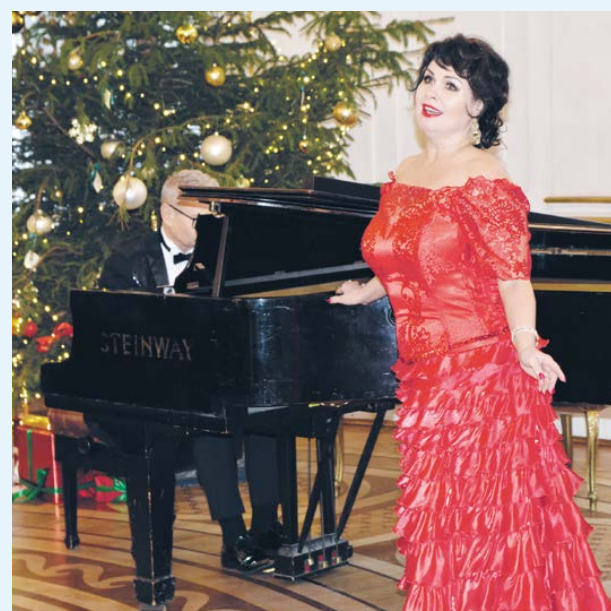
fol. Powiat Legionowski

Tak okazały zestaw dobrze znanych arii i piosenek spr-