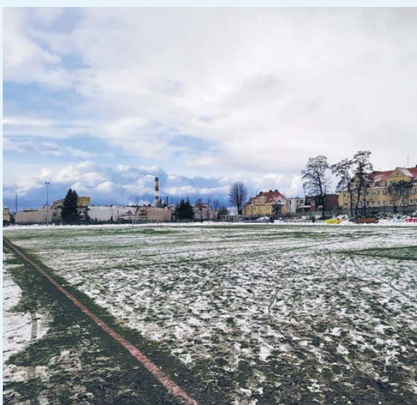
fort. KS Legionovia Legionowo

W tym roku piłkarze Legionovii Legionowo nie poprawią już, niestety, swojego dorobku punktowego. Mający się odbyć w sobotę mecz z Concordią Elbląg został odwołany z powodu złych warunków atmosferycznych.