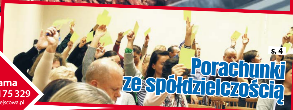
s. 4 Porachunki ze spółdzielczością

Reklama tel. 797 175 329 reklama@miejscowa.pl