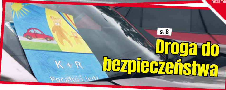
s. 8 Droga do bezpieczeństwa