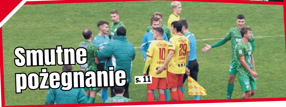
s. 11 Smutne pożegnanie