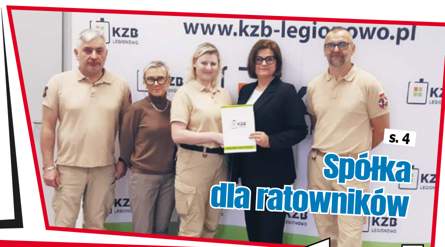
s. 4 Spółka dla ratowników

nr 41/1085, GAZETA BEZPŁATNA TYGODNIK POWIATU LEGIONOWSKIEGO