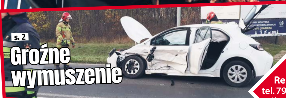
s. 2 Groźne wymuszenie

Reklama tel. 797 175 329 reklama@miejscowa.pl