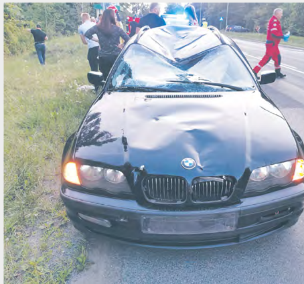
KP PSP Legionowo

Do kolejnej tragedii doszło w czwartek (27 lipca) na drodze wojewódzkiej nr 630 w Rajszewie. Około godziny 20.00 do służb dotarła informacja, że w pobliżu skrzyżowania ul. Modlińskiej z Gólfową samochód osobowy marki BMW potrącił rowerzystę. Natychmiast wysłano tam straż pożarną, policję oraz śmigłowiec Lotniczego Pogotowia Ratunkowego.