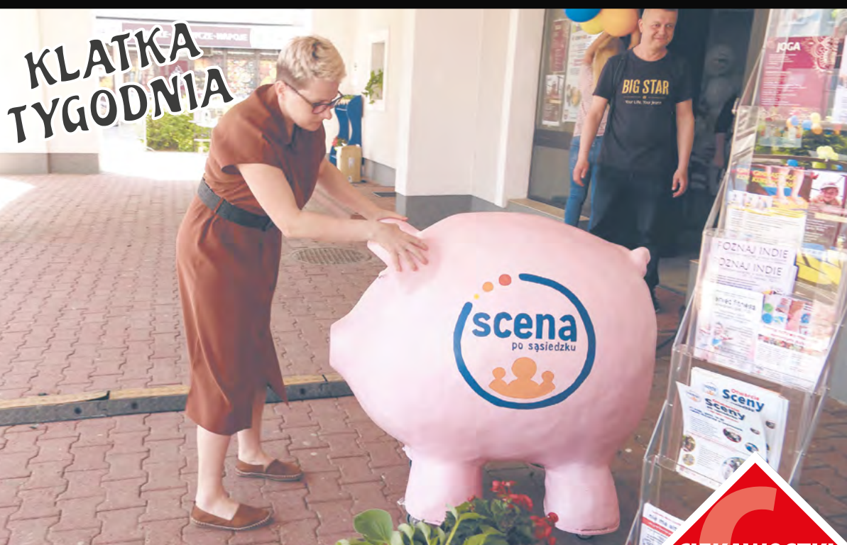
Bywają, jak widać, sytuacje, kiedy nawet samemu sobie warto podłożyć świnię...