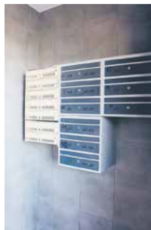
ul. Polskiej Organizacji Wojskowej 3

szankowa C, gdzie wymieniono piony ciepłej i zimnej wody oraz wyremontowano dach, tu wartość nakładów przekroczyła 178 tys. zł. Ponad 150 tys. spółka zainwestowała w modernizację budynku przy ul. Polskiej Organizacji Wojskowej 3, oprócz typowych konser-