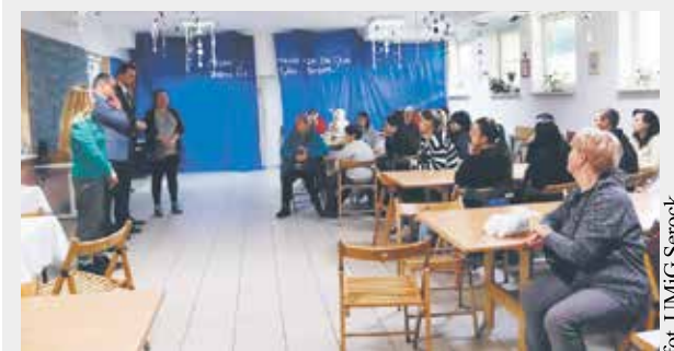
fol. UMfG Serock