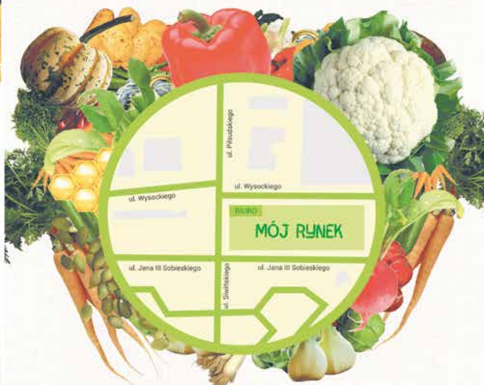
Targowisko „Mój Rynek” czynne jest 7 dni w tygodniu.