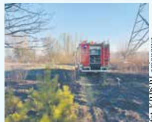
fol. KP PSP Legionowo

Przypominamy, że wypalanie traw i nieużytków rolnych jest zabronione. Grozi za to kara grzywny w wysokości 5 tys. zł, a nawet kara 10 lat pozbawienia wolności. Za wy-