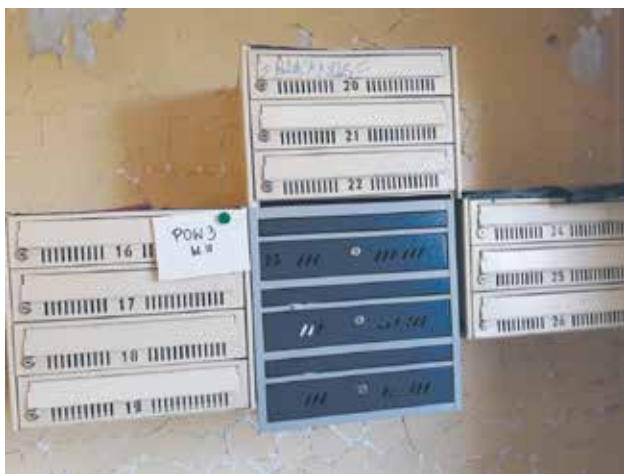
ul. Polskiej Organizacji Wojskowej 3 przed remontem

Póki co z setkami wniosków urzędnicy dają sobie radę. Na miejskiej stronie internetowej pojawił się jednak krótki komunikat. „Szanowni Państwo, w związku z sytuacją na Ukrainie w naszym biurze paszportowym odnotowujemy wzmożony ruch. Prosimy więc o wyrozumiałość, ponieważ może się zdarzyć, że nie będziemy w stanie obsłużyć wszystkich chętnych”.