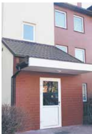
ul. Polskiej Organizacji Wojskowej 3

Głównym celem realizowanym przez spółkę jest oczywiście utrzymanie mienia w jak najlepszym stanie technicznym przy wykorzystaniu zabudżetowanych na ten cel środków finansowych. Regularne przeglądy, modernizacje, konserwacje: hydrauliczne, elektryczne, budowlane, remonty klatek schodowych, ale również wymiany okien, nowe przyłącza wodne, dostosowania do wymogów formalnych prawa budowlanego, czy przepisów przeciwpożarowych, to jakby chleb powszedni dla działań spółki. Cel jest jeden, chodzi o to, aby żyło się lepiej, aby dzieci korzystały z dobrze wyposażonych i bezpiecznych punktów oświatowych, szkolnych, przedszkolnych, aby obiekty sportowe właściwie spełniały swoją rolę i aby tym, którzy faktycznie tego potrzebują zapewnić przysłowiowy dach nad głową.