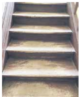
ul. Kościuszki 7 przed remontem

Aby nie być gołosłownym w podsumowaniach działalności spółki KZB Legionowo należy spojrzeć na liczby, które mówią same za siebie. Biorąc pod uwagę lata 2019, 2020, 2021 wyraźnie widać tendencję wzrostową w poniesionych nakładach finansowych dot. remontów części wspólnych oraz konserwacji legionowskich lokali komunalnych i socjalnych. W 2019 roku spółka przeprowadziła prace o wartości prawie 475 tys. zł., w roku 2020 była to kwota sięgająca prawie 700 tys., a w roku 2021 roku, jak już zostało wcześniej wspomniane wartość remontów i modernizacji sięgnęła powyżej 1 000 000 zł. Zatem w ciągu dwóch lat o 100% wzrosły nakłady finansowe przeznaczone na ten cel, co wyraźnie przełożyło się na zakres ulepszeń możliwych do przeprowadzenia.