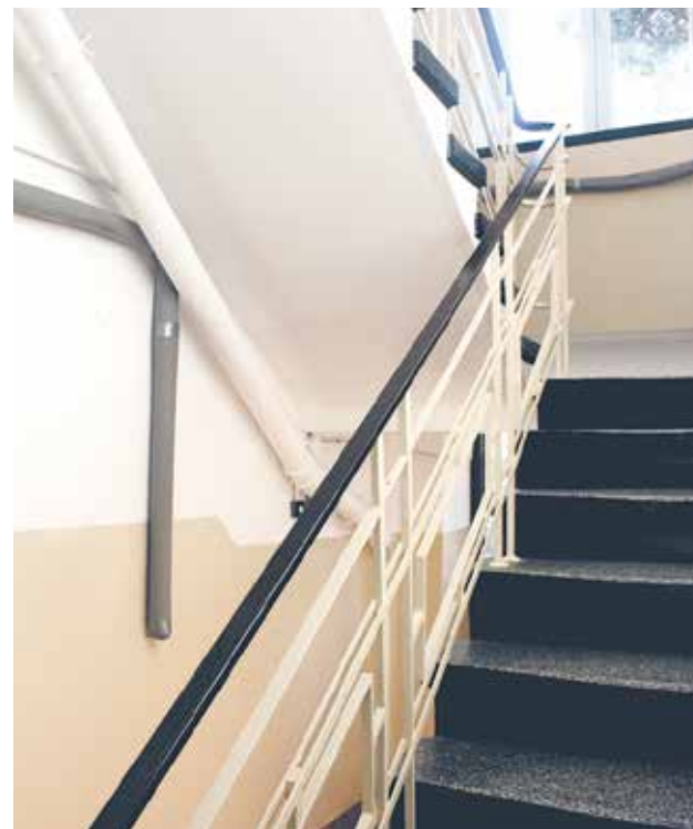
ul. Narutowicza 6

nek zlokalizowany pod adresem Polskiej Organizacji Wojskowej 8 po pożarze wymagał nowej instalacji elektrycznej.