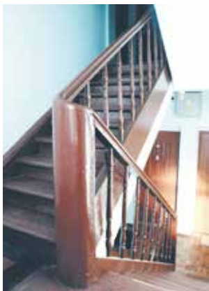
ul. Kościuszki 7