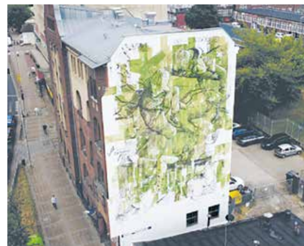
Ekomural w Szczecinie

“Pod wpływem promieniowania UV, tlenu i wilgoci toksyny ulegają rozkładowi. Przekształcają się w bezpieczne azotany i węglany. Szacuje się, że 1 metr kw. redukuje 0,44 g tlenków azotu dziennie” – wyjaśniono.