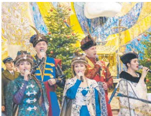
Tym razem muzycy i wokaliści w mundurach przyjechali do Legionowa uzbrojeni po zęby w repertuar śpiewany przy okazji

Nie odwiedza Legionowa często, ale gdy już to robi, jest co oglądać i czego posłuchać. Mowa oczywiście o Reprezentacyjnym Zespole Artystycznym Wojska Polskiego, który w poprzednią niedzielę (16 stycznia) dał wspaniały koncert w kościele parafii Matki Bożej Fatimskiej. I na nowo roztoczył wokół jego słuchaczy magię świąt.