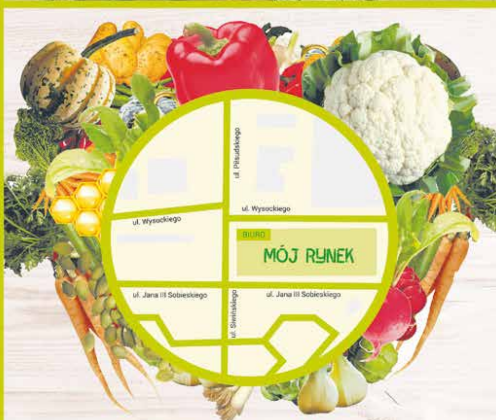
Targowisko „Mój Rynek” czynne jest 7 dni w tygodniu.