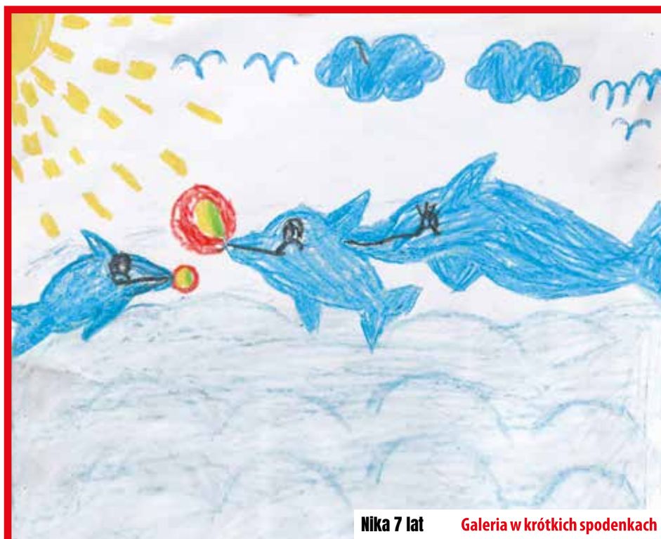
Nika 7 lat Galeria w krótkich spodenkach