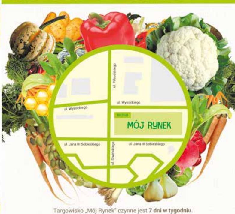
Targowisko „Mój Rynek” czynne jest 7 dni w tygodniu.