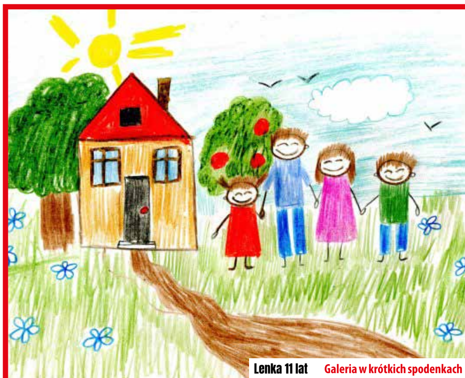
Lenka 11 lat Galeria w krótkich spodenkach

... Cnota zatopionych kobiet i dzieci pływała po jeziorze Świtez w postaci białych lilii.