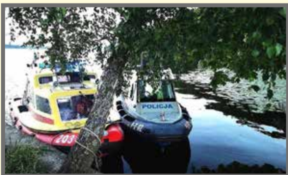
fol: Legionowskie WOPR